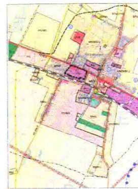
FRAGMENT STUDIUM UWARUNKOWAN I KIERUNKÓW ZAGOSPODAROWANIA PRZESTRZENNEGO GMINY STRZĄKOWO ----- GRANICA OBSZARU OBJĘTEGO PLANEM