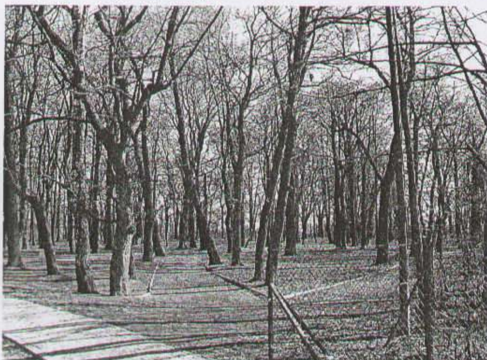
fol. Zdrowotny park w Strzałkowie

Teren Strzałkowa jest dość płaski, pozbawiony większych skupisk wodnych, w tym jezior. Brak wielkiego przemysłu, a co za tym idzie - czyste, zdrowe powietrze i pełne uroku leśne i parkowe zakątki - stanowią o walorach turystycznych Strzałkowa. Turystów zainteresują piękne obiekty przyrodnicze, np. założony w I połowie XIX wieku park w Strzałkowie, uznawany obecnie za zdrowotny. Występują w nim tak zwane czakry, czyli miejsca wpływające korzystnie na niektóre schorzenia.