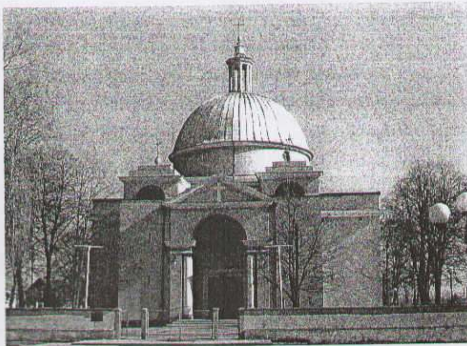
fot. Kościół w Strzałkowie pw. św. Doroty

Świątynię wzniesiono w 1934 r. na miejscu dawnego, drewnianego kościoła z 1397 roku. Z przeszłości zachowało się jego wyposażenie: rokokowy krucyfiks procesyjny, barokowa monstrancja, kielich i ornaty z początku XVIII w.