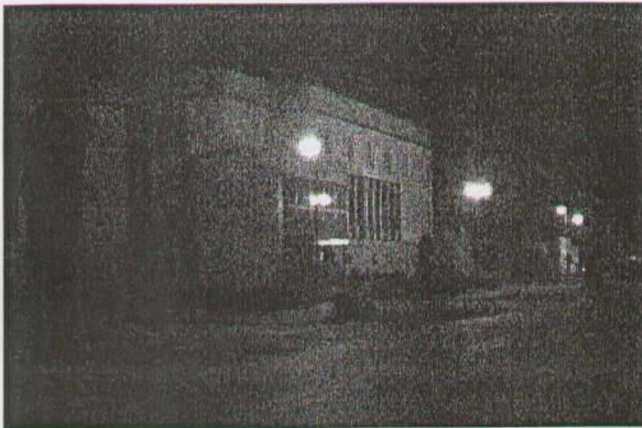
fol. Bank Spółdzielczy w Strzałkowie