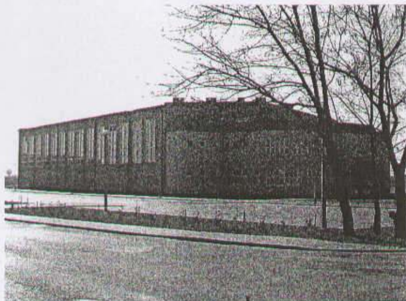
fol. Hala widowiskowo-sportowa

W dalszym ciągu brakuje tu obiektów i miejsc do czynnego uprawiania sportu, a także placu zabaw dla dzieci. Sala sportowa przy Zespole Szkół Ponadgimnazjalnych nie zaspakaja potrzeb mieszkańców Strzałkowa.